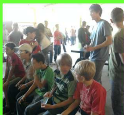
Congresso Esportivo do DINOCA

Aconteceu nos dias 04 e 05 de junho mais um encontro Esportivo do Distrito Nordeste Catarinense - DINOCA , onde estiveram aproximadamente 200 jovens luteranos reunidos em comunhão. Ah, uma coisa bacana, esse número foi mais do que o esperado pela diretoria.