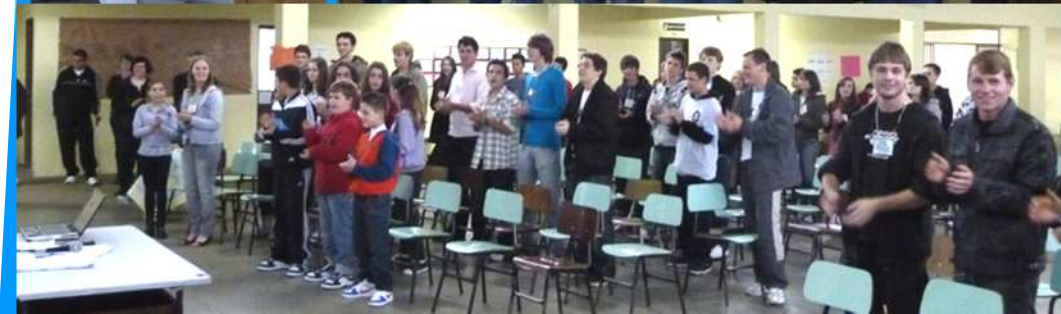
Congresso Espiritual do DIVARP